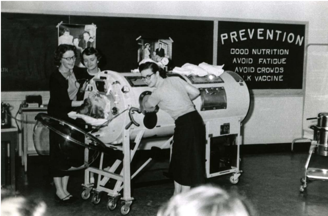
Public health nursing students demonstrate use of an iron lung for treatment of poliomyelitis during UBC Open House, 1955 Étudiantes infirmières en santé publique faisant la démonstration de l'usage d'un poumon d'acier pour le traitement de la poliomyélite durant une activité « portes ouvertes » de UBC en 1955

University of British Columbia, Vancouver